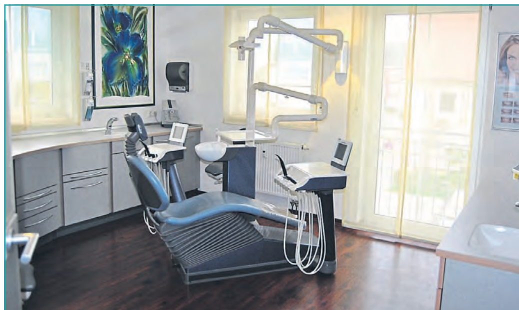
Eine hochmoderne Praxisausstattung ist Voraussetzung für eine optimale Prophylaxe und erfolgreiche Behandlung.